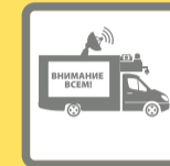
ПОДВИЖНЫЕ ЗВУКОУСИЛИТЕЛЬНЫЕ УСТАНОВКИ